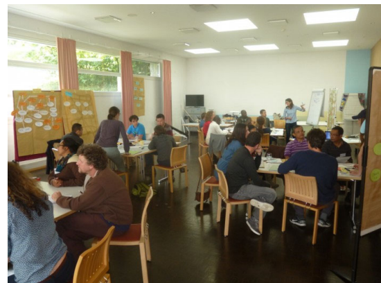
Participants dans la même formation travaillant sur une étude de cas