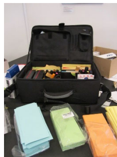
Matériel de facilitation

Nous mettons à disposition gratuitement du matériel de facilitation comme des marqueurs, du papier Kraft etc.