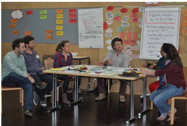
Participants d'une formation en Suisse mettant en scène une situation difficile de facilitation

Notre format repose sur un équilibre entre les cas apportés par les participants, les mises en situation, des jeux de rôles, des réflexions collectives autour des expériences évoquées en session, du feedback par les pairs et des apports par le formateur. Nous apporterons du matériel de facilitation (papier Kraft, cartons, marqueurs,...) comme visibles sur les photos. Nous fournissons aussi un manuel de plus de 80 pages expliquant la posture, la démarche, les méthodes et outils.