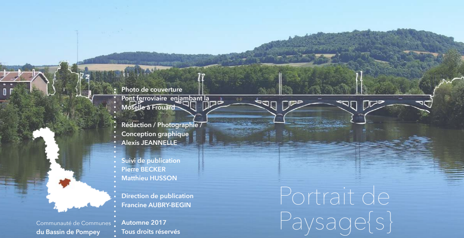
Photo de couverture Pont ferroviaire enjambant la Moselle à Frouard Rédaction / Photographie / Conception graphique Alexis JEANNELLE Suivi de publication Pierre BECKER Matthieu HUSSON Direction de publication Francine AUBRY-BEGIN Automne 2017 Tous droits réservés

Le paysage de la Communauté de Communes est fortement marqué par la Moselle. À l'ouest, la Moselle forme une vallée qui le bordent sont plus abrupts. En vallée plate et peu élargi, les coteaux de vallons du Grand Couronné. Le relief est structuré par un fond de vallons, etc. Elles fondent ainsi particulièrement prononcés sur le si fondé des paysages de vallées La Meurthe et la Moselle ont ainsi fondé des paysages de vallées de la région. La Meurthe et la Moselle ont ainsi fondé des paysages de vallées de la région. La Meurthe et la Moselle ont ainsi fondé des paysages de vallées de la région.